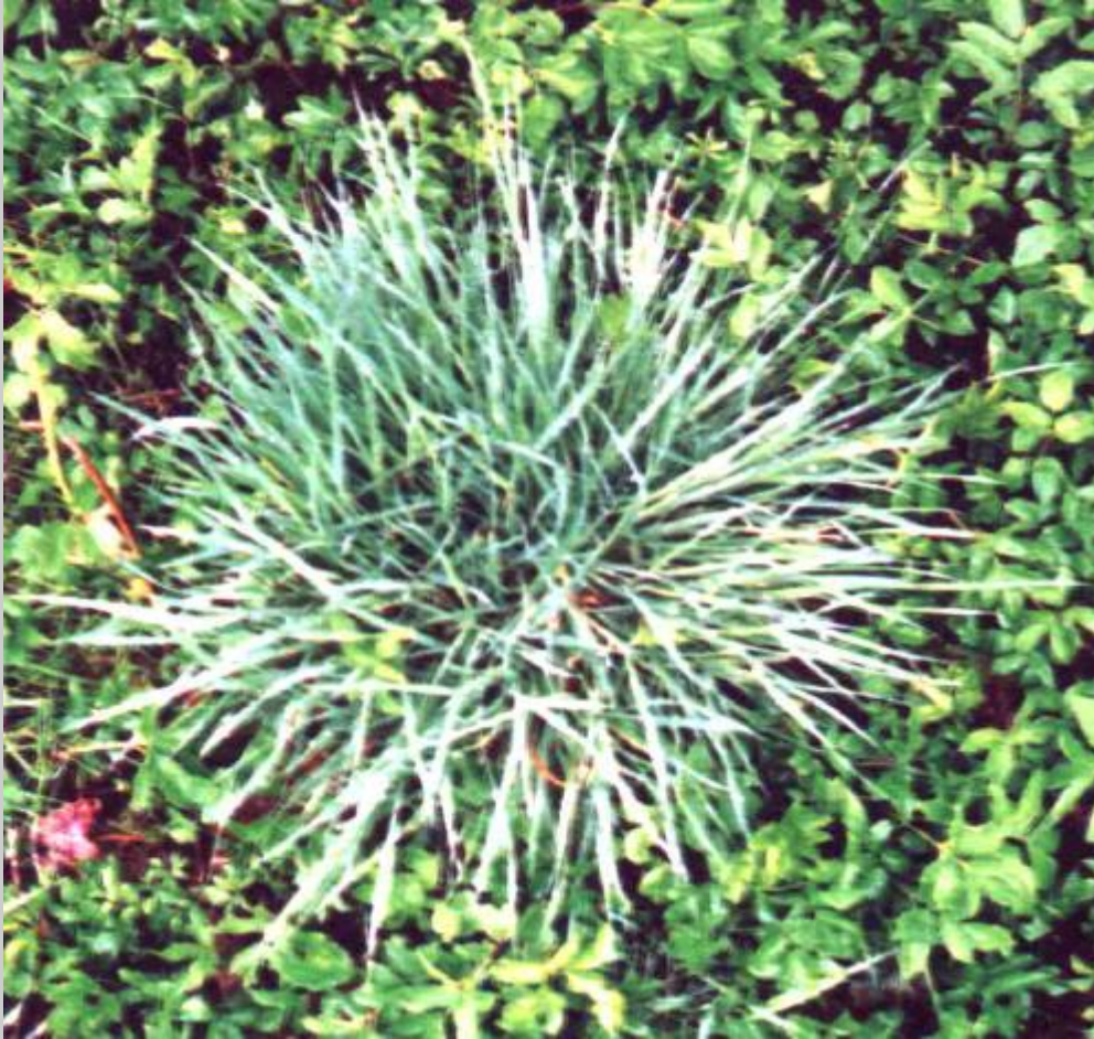
Ein System eingebettet in ein anderes System.

Beobachtung ist vom Beobachter abhängig.