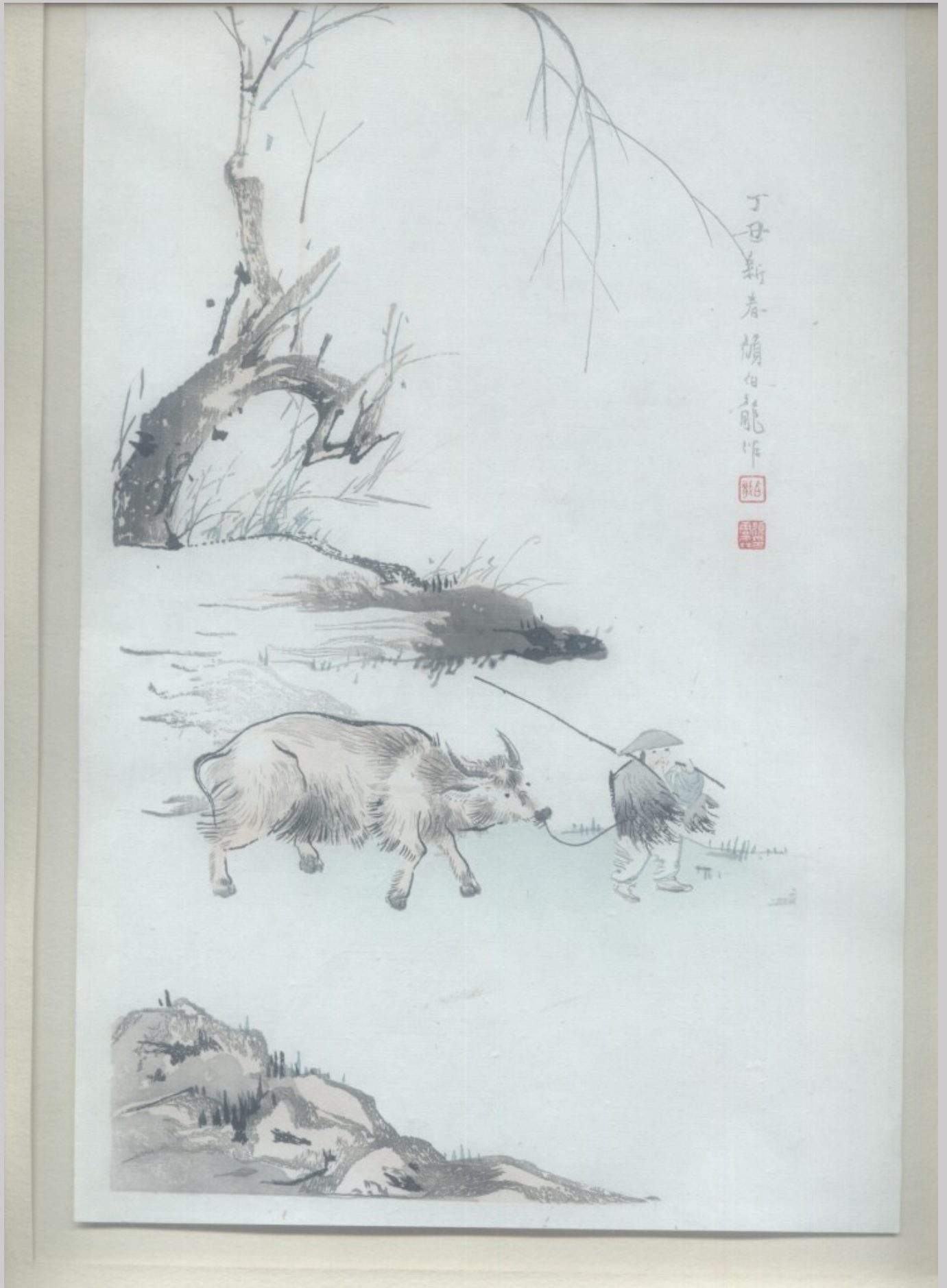
Das ur-alte chinesischen Bild des Hirten (die konfuzianische Hierarchie), die den Ochsen (das Kapital) am Nasenring führt. Bild: Tuschezeichnung, um