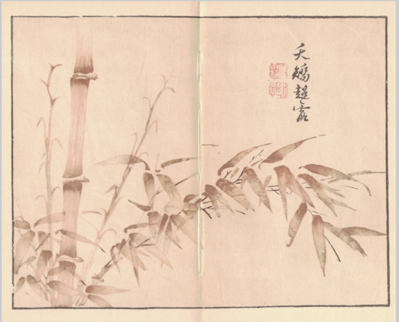
Bild eingescannt aus „Chinesische Holzsnitte“. Inselbücherei, Leipzig 1954.