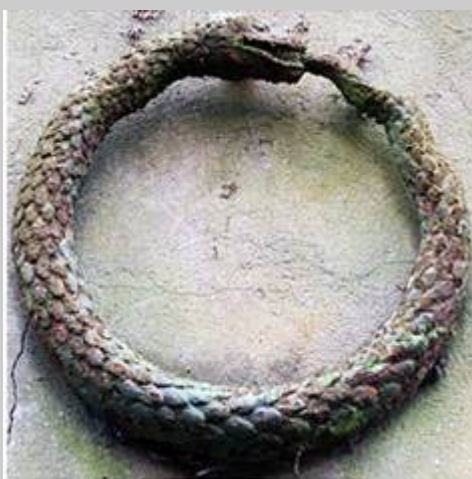
Uroboros, die Schlange, die sich selber frisst

Der Schlangenkreis entsprach der Urphilosophie starker Helden und kluger Frauen, die frei und riskant lebend Steppen durchstreiften, Beeren sammelten und Wildgetreide hüteten, und die mit der Zukunft des Todes in die Vergangenheit der Ahnen zurückkehrten, um neu geboren zu werden. Der Mensch dieses Paradieses empfand sich als unmündiges Baby von Mutter Natur und war deren Liebe und Boshaftigkeit vollkommen ausgeliefert.