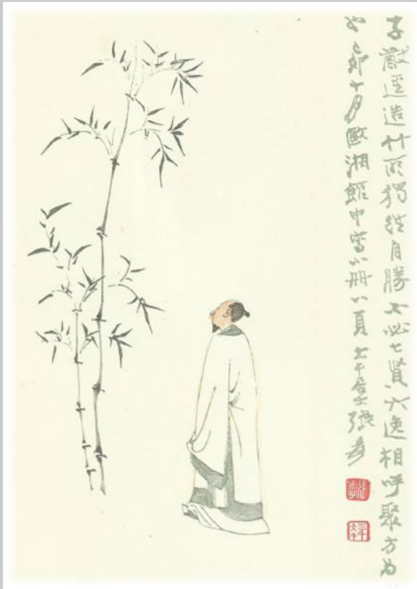
Chang Ta-cien: Der Lärm von sieben Weisen und sechs Gelehrten ist nicht nötig, den Bambus sprießen zu lassen. Ed. Holz Leipzig 1975.