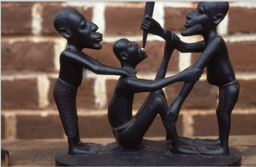
Makonde-Zahnarzt, Jäger Tansania 1983

Lebenspflege: Förderung gesunder Verhältnisse